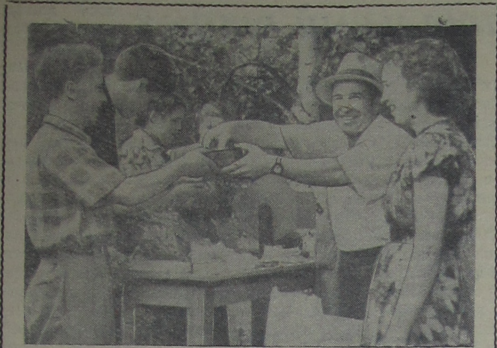
Острова на Московском море — излюбленное место отдыха дубненцев. Здесь часто проводятся массовые гулянья. На снимке: массовка строителей. Розыгрыш лотереи.