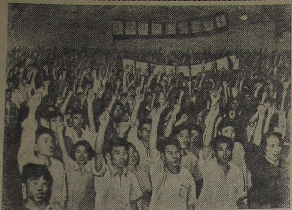
Китайская Народная Республика. Рабочие и инженерно-технический персонал Шинзиньшаньского металлургического завода близ Пекина провели митинг и демонстрацию в поддержку заявления премьера Государственного совета КНР Чжоу Энь-лая об обстановке в районе Тайваньского пролива. На снимке: участники митинга скандируют лозунги.