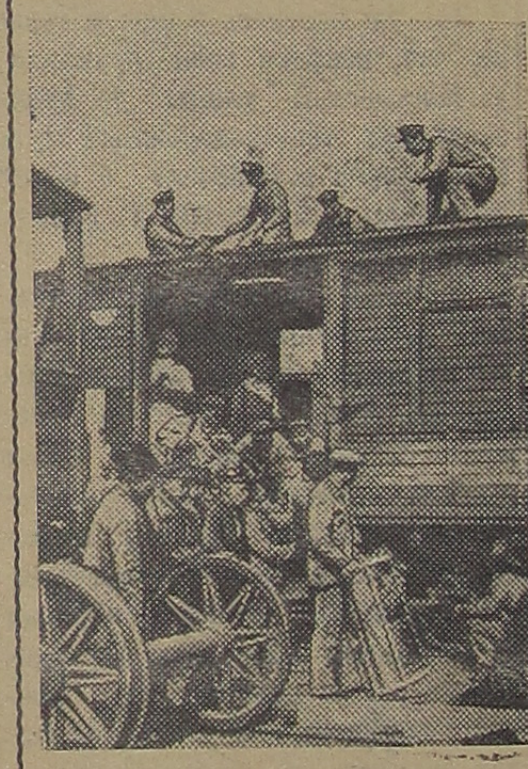
После победного окончания гражданской войны комсомол принял по призыву Коммунистической партии самое активное участие в восстановлении народного хозяйства. На снимке: субботник на Московской железной дороге. Бригада молодых рабочих производит ремонт вагонов 1 мая 1920 года.

Идем вперед сплоченным строем, Сильны единством своих рядов. Мы любим жизнь, мы счастье строим, Однем землю в наряд садов. Живем по ленинским заветам — Великой партии сыны. И коммунизма лучистым светом Дороги наши озарены. За мир и дружбу стеною встанем, Военный призыв победим, За правду битвы не перестанем, Пока сердца горят в груди. Пусть песня льется, звенит над нами, К отчизне нашей любви полны, Сжимаем крепко родное знамя, Мы комсомольцы — весна страны. В. Владимиров.