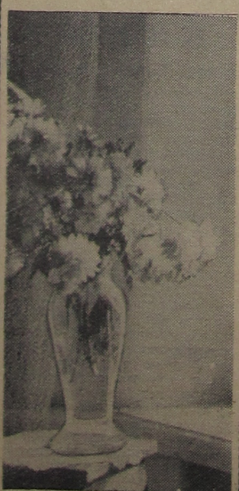
Последние цветы.