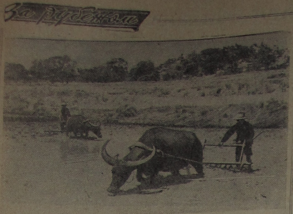
На снимке: Филиппины. Крестьяне вспахивают поле на крутогорных буйволах.