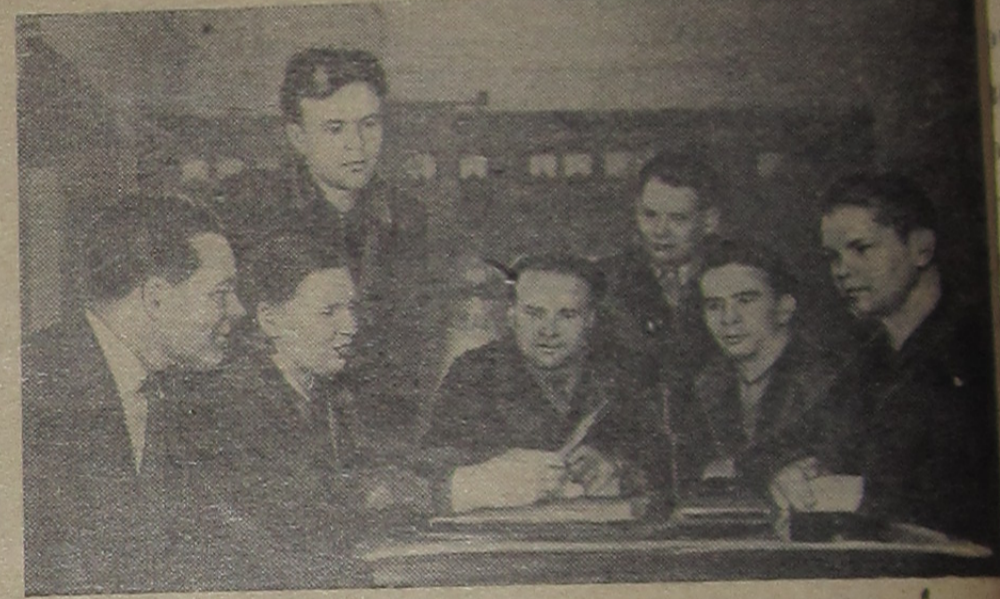
В ОТДЕЛЕ главного энергетика Лаборатории высоких энергий хорошо работали в 1958 году многие инженеры, техники и механики, обеспечивая бесперебойную работу лаборатории.

Около 70 агитаторов от партийных и комсомольских организаций АХУ Института, горсовета и медсанчасти проводят сейчас работу с избирателями на своих участках.