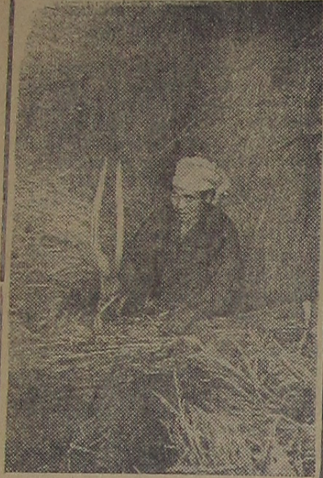
ЯПОНИЯ. В гористых районах префектуры Ивате все еще существует феодализм. Крестьяне выжигают древесный уголь в лесах, принадлежащих помещику, которого они называют «императором». Часть дней в году они обязаны работать бесплатно. Основным продуктом питания местного населения является просо. Смертность от недоедания среди детей достигает 50 процентов. На снимке: крестьянка обмолачивает просо.