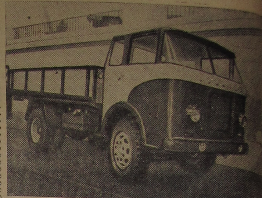
МОСКВА. На Выставке достижений народного хозяйства СССР в павильонах атомной энергии, химической промышленности, легкой промышленности, машиностроения представлены новейшие образцы машин, станков, приборов и т. д. На снимке: один из экспонатов павильона «Машиностроение» — опытный образец грузового автомобиля Кузнецкого автомобильного завода «КАЗ-605» грузоподъемностью 5000 килограммов. Максимальная скорость машины — 75 километров в час. Двигатель 6-цилиндровый мощностью 108 лошадиных сил.