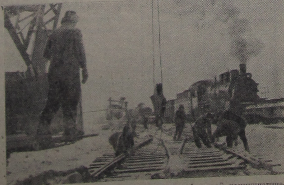
корпуса подсобных предприятий и служб.

Иркутская область. Больше года напряженно трудится в предгорьях Восточных Саян коллектив строительно-монтажного поезда № 288. Молодые патристы, приехавшие сюда по комсомольским путевкам из разных областей страны, сооружают крупную железнодорожную магистраль Тайшет—Абакан. Более чем на 600 километров сквозь леса, степи и седые отроги Саянских гор протянется новая линия, откроется доступ к несметным богатствам, которые таит в себе недра восточных областей нашей страны.