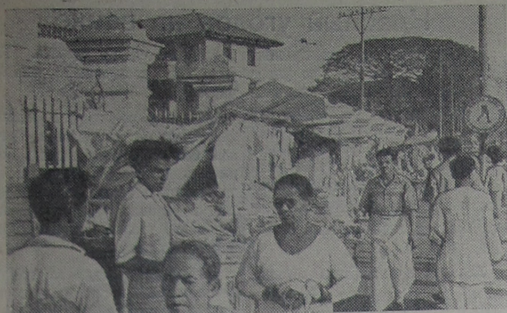
На улице в одном из наиболее густо населенных районов столицы Цейлона — Коломбо.