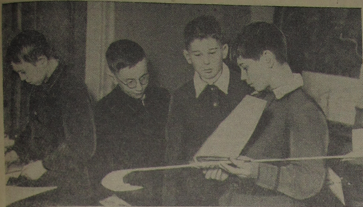
В авиамодельном кружке детского сектора при ДOME культуры занимается много ребят.