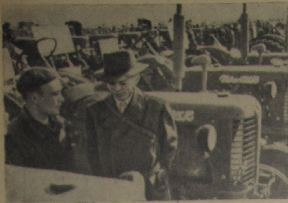
Растут и крепнут венгерские сельскохозяйственные производственные кооперативы. Большого успеха достигло кооперативное движение в области Сольнок. Здесь 90 процентов пахотной земли обрабатывается кооперативными хозяйствами. Недавно кооператоры области получили 102 универсальных чехословацких трактора и 320 сельхозмашины.

На снимке: осмотр трактора.