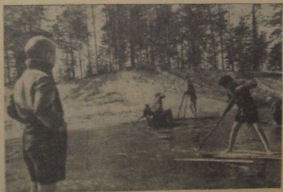
Любимое занятие.

В ответ на заметку «Позабойтись уже сейчас» тов. Маркелов пишет: «К празднику 1 Мая наш город приведен в надлежащий порядок. Железные урны установлены во дворах, правда, их недостаточно, но нами заказано еще 100 железных мусоросборников, которые в мае месяце будут установлены. С медсестричкой и с дежурным заключен договор на санитарную обработку мусоросборников во дворах».