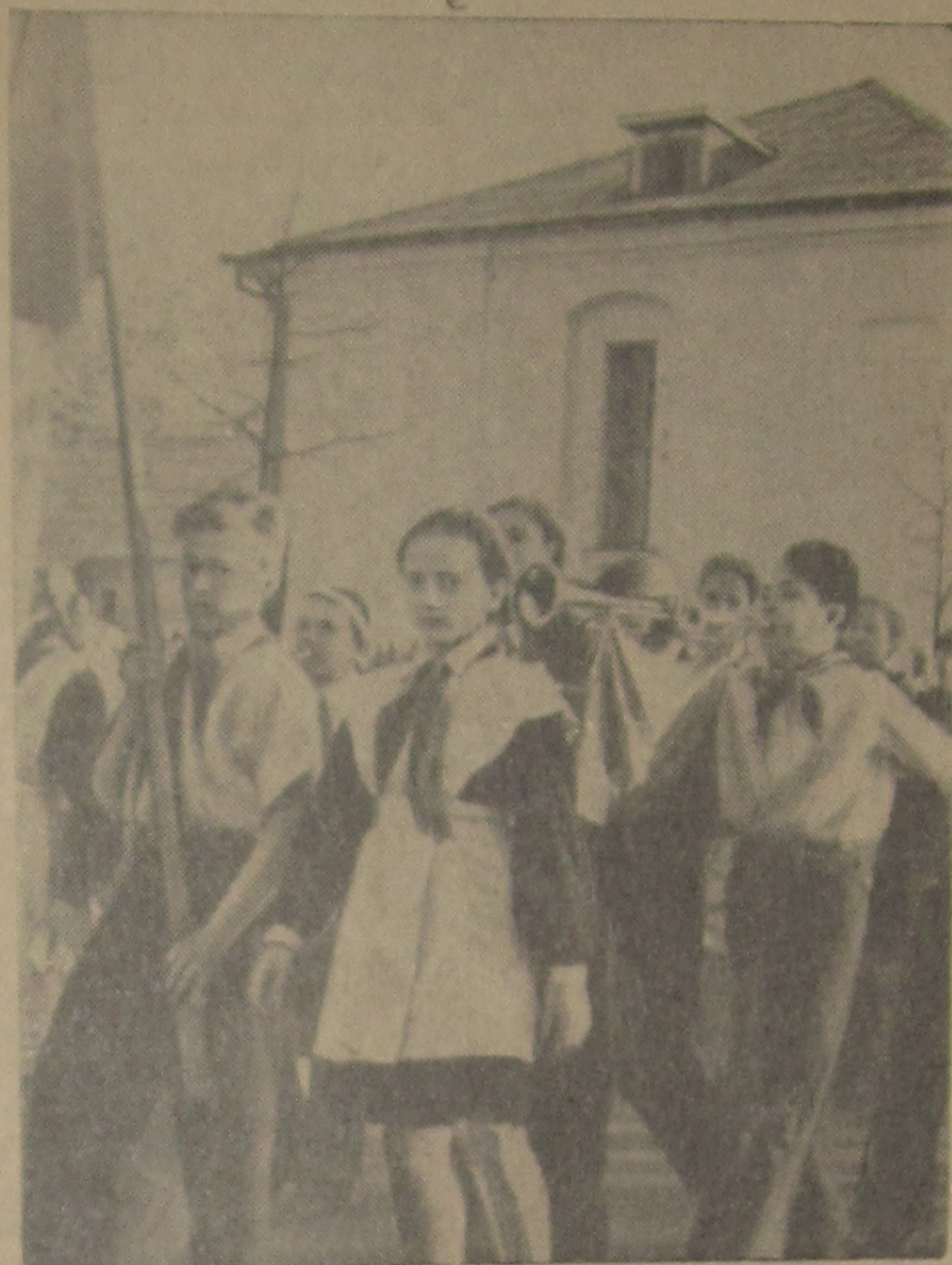
По всей стране звучат сегодня пионерские горны, раздаются торжественная дробь барабана. В это весеннее утро юные ленинцы Дубны, как и пионеры других городов и сел, празднуют День рождения пионерии.

Идет отряд имени Павла Морозова.