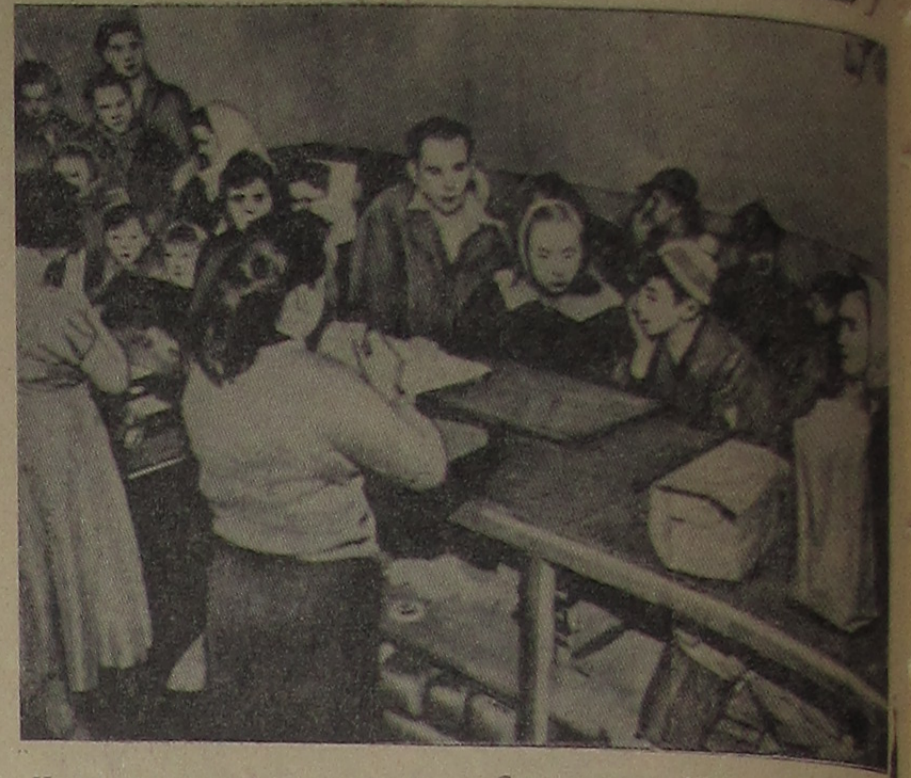
К экономическому положению в Соединенных Штатах Америки. Штат Мэн. Очередь нуждающихся на пункте, где выдают продукты.