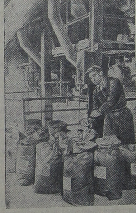
На снимке: готовые удобрения подготавливаются к отправке в колхозы Сталинской области.

Сейчас завод «Автостекло» изготавливает 30 тонн таких удобрений для колхозов и совхозов Сталинской области.