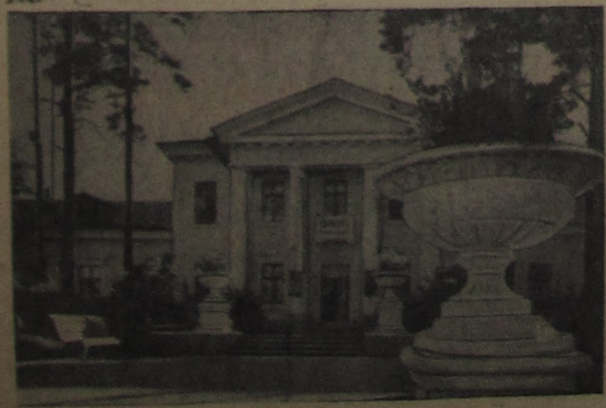
Особую красоту многим зданиям нашего города придают лепные украшения: карнизы, капители колонн, нарядные вазы. Все это выполнено трудолюбивыми руками лепщиков.

Решения июньского Пленума ЦК КПСС встречены нашим коллективом горячим одобрением. Рабочие и инженерно-технические работники конторы полны решимости выполнить решения нашей родной партии, резко поднять производство, улучшить качество изделий, снизить их себестоимость.