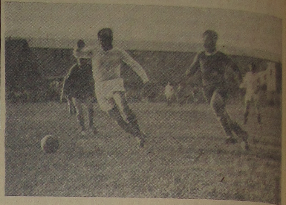
Острый момент у ворот.