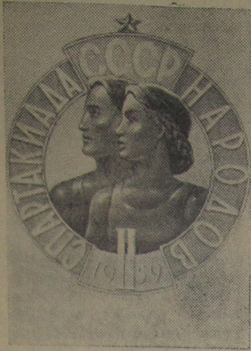
Эмблема II Спартакиады народов СССР.

Вся страна будет отмечать завтра День физкультурника. В этом году праздник совпал с началом второй Спартакиады народов СССР. Лучшие спортсмены всех союзных республик будут мериться силами на стадионах, спортивных площадках, на ринге и на борцовском ковче.