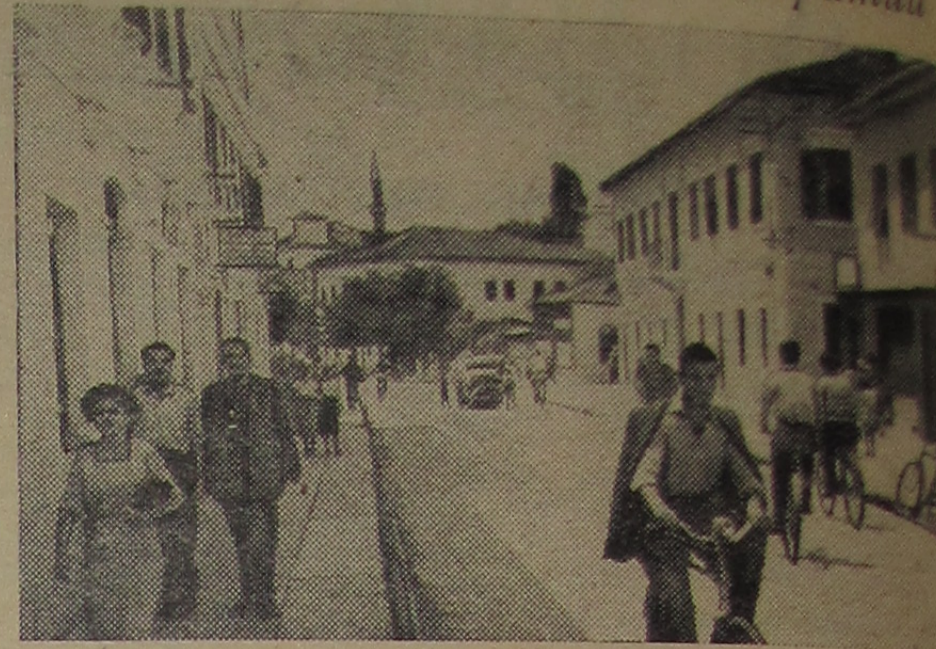
Народная Республика Албания. На одной из улиц города Шкодера.