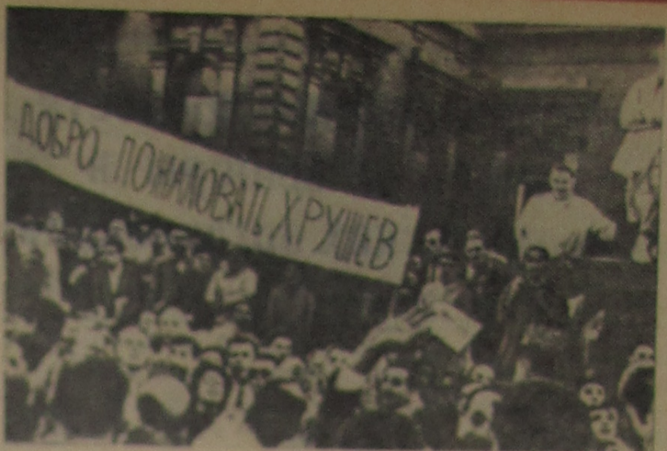
На снимке: жители Сан-Франциско ожидают приезда Н. С. Хрущева.

Каждый из нас должен стремиться к повышению своей трудовой активности. Мы должны работать лучше, чтобы наша страна могла развиваться и процветать.