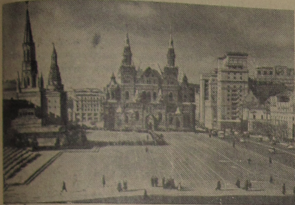
МОСКВА, Красная площадь.