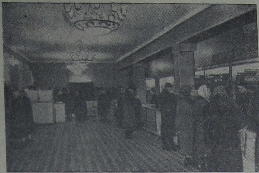
На снимке: в торговом зале протоварного магазина № 16.