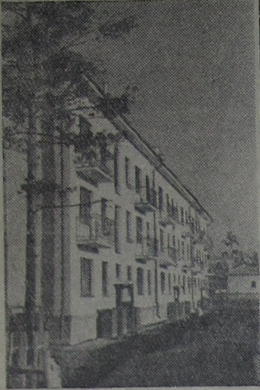
Новый жилой дом на Комсомольской улице.