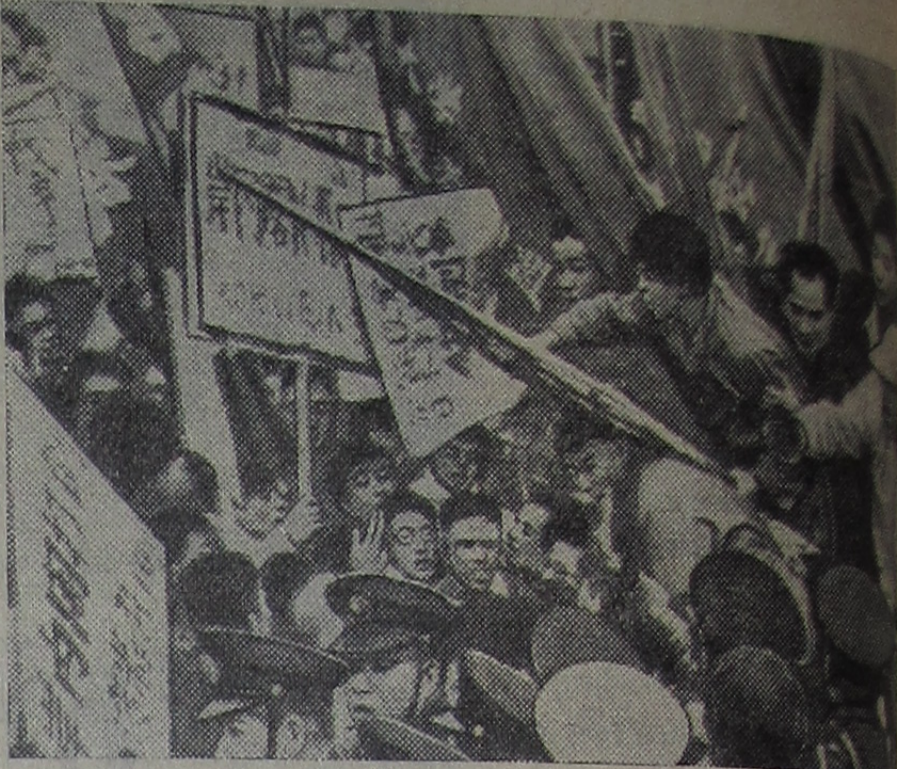
ЯПОНИЯ. Токио. 4 миллиона человек вышли на демонстрацию против пересмотра японо-американского «договора безопасности». Это восьмое по счету общественное выступление масс против пересмотра «договора безопасности».

На снимке: во время демонстрации. Фото агентства Синхуа. (Снимок принят по фототелеграфу ТАСС.)