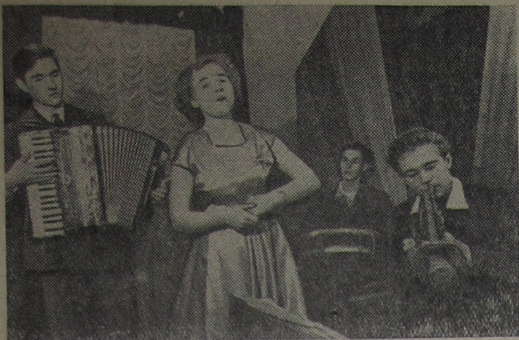
БЕЛОРУССКАЯ ССР. Коллектив художественной самодеятельности Островецкого Дома культуры Молодечненской области пользуется большой популярностью в колхозах Островецкого района. В состав коллектива входит более ста человек — рабочие, служащие, учащиеся. Они занимаются в драматическом, хоровом, танцевальном и музыкальном кружках.

С интересной программой выступает самодеятельный эстрадный оркестр. В его репертуаре — произведения советских композиторов, русские и белорусские народные песни, а также песни и танцы стран народной демократии.