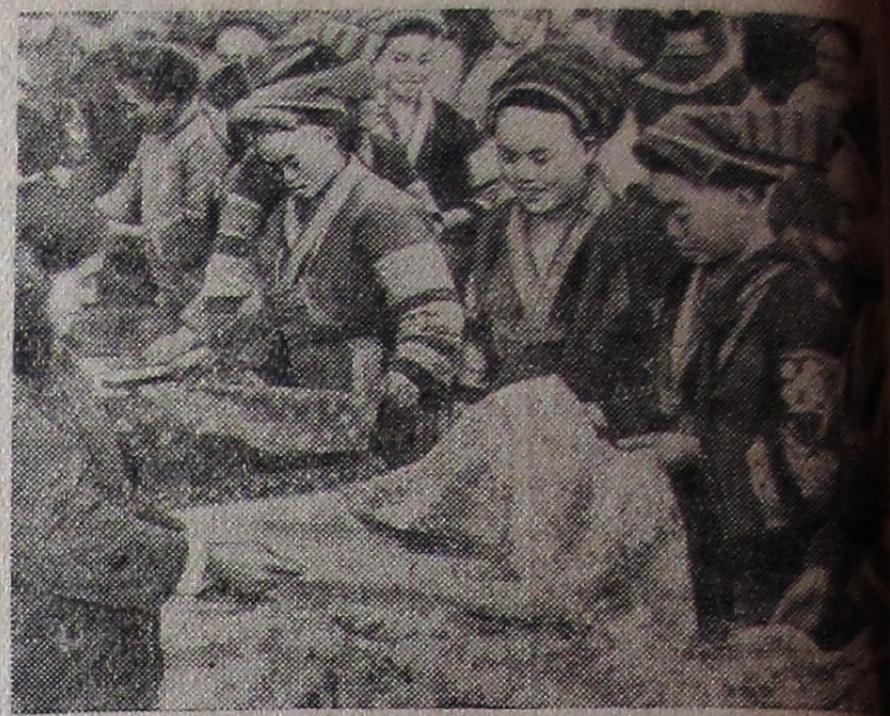
Китайская Народная Республика. Женщины — представительницы национальных меньшинств покупают ткани на сельском базаре в провинции Гуйчжоу (Юго-Западный Китай).