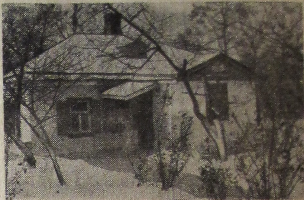
Дом в Таганроге, где родился А. П. Чехов. Ныне дом-музей А. П. Чехова.