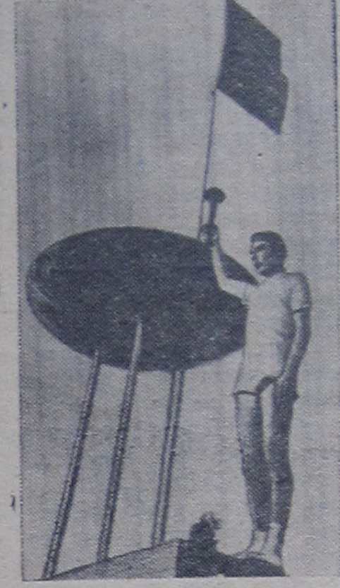
Рим. Общий вид Олимпийского стадиона во время XVII Олимпийских игр.