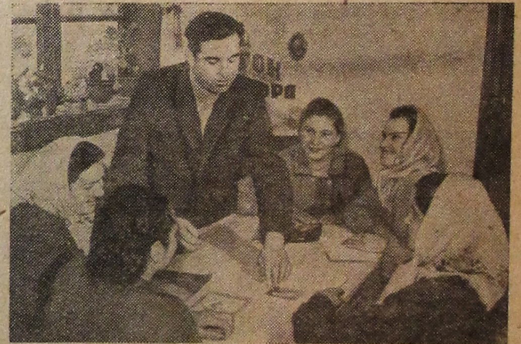
РОВЕНСКАЯ ОБЛАСТЬ. На животноводческие фермы колхоза «40 рлчя Жовтня» Демидовского района пришли 16 юношей и девушек, которые стали работать ездовыми, доярками, свиноводками, телятницами. Молодежь трудится с большим старанием, перенимает опыт передовиков, с интересом изучает зоотехнику.

С. Конев, по поручению группы рабочих котельного цеха.