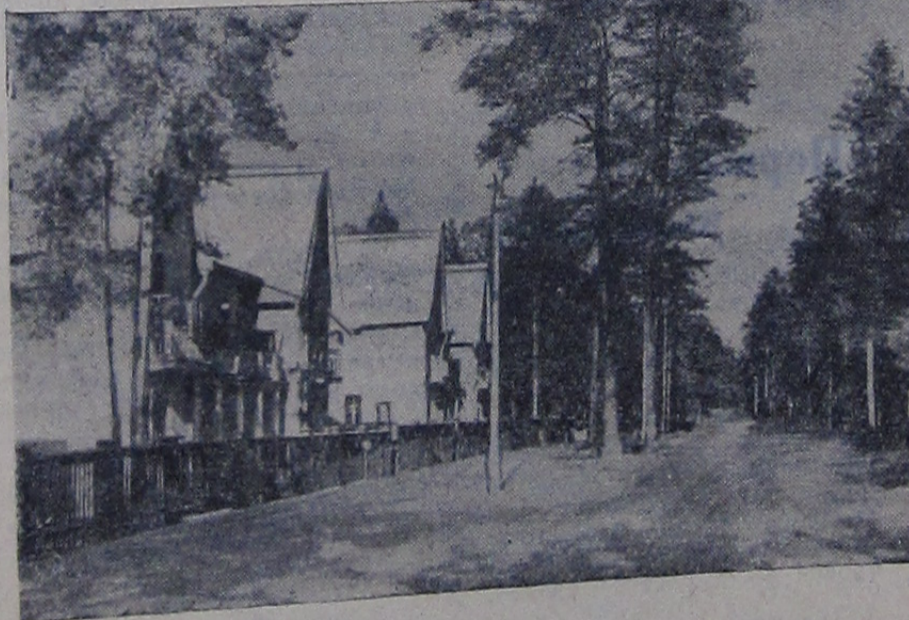
Самая молодая улица Дубны — Лесная.