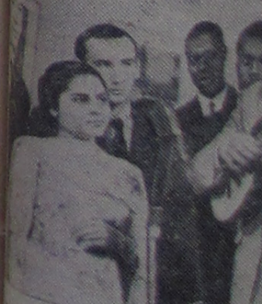
В клубе Университета студентам университета снимается в Венесуэлу. А. Батанова.

В настоящее время почти каждая экспериментальная работа требует многих часов математической обработки на электронных машинах. Если вычисления, связанные с непосредственной обработкой экспериментальных данных, как например, расшифровка взаимодвижений по спектрам, которые оставляют в камере частицы, требуют стандартных математических вычислений.