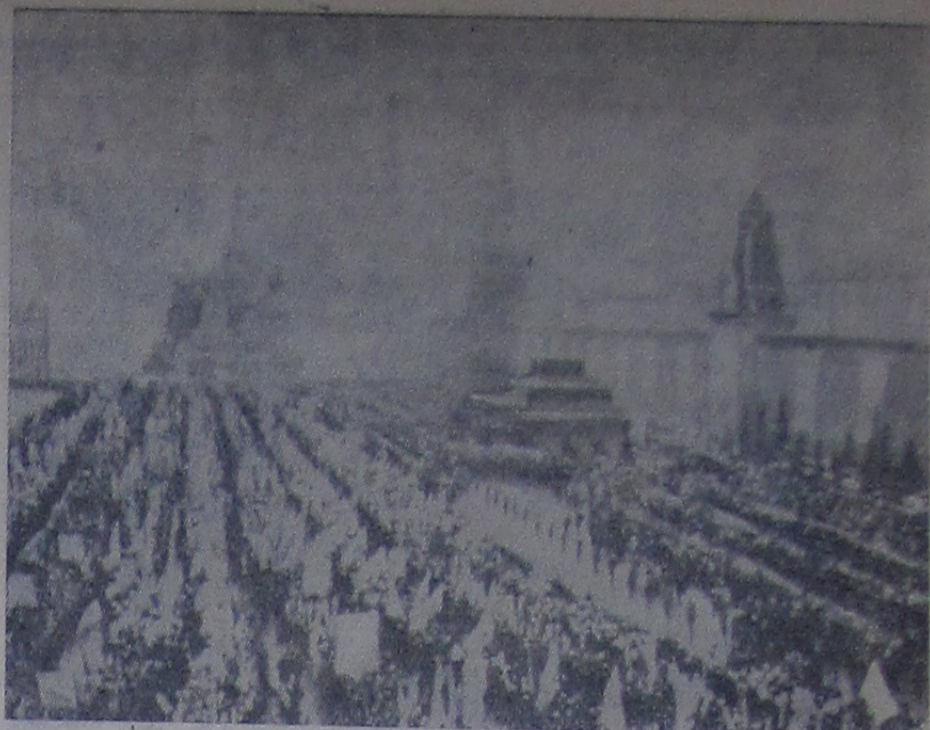
Торжественно и радостно отметили советские люди светлый праздник Великого Октября.

Праздничная демонстрация иваньковцев — это трудовой рапорт успешного выполнения семилетнего плана, роста небывалой политической активности масс, строящих самое счастливое общество — коммунизм.