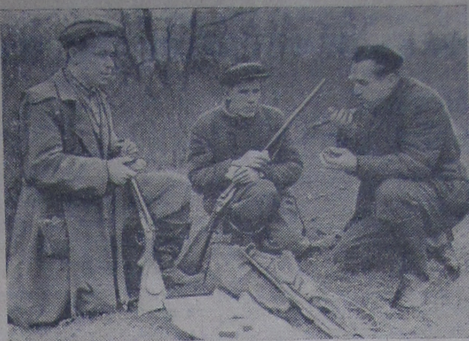
Охотники на привале

Адрес редакции: гор. Дубна, Советская, 11. Телефоны: редактор — Институт 2-81, общий — городской 23 и 4-73. Дни выхода газеты: вторник, четверг и суббота.