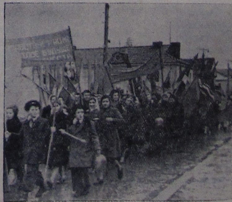
Демонстрация трудящихся города Иванькова 7 ноября 1960 года.