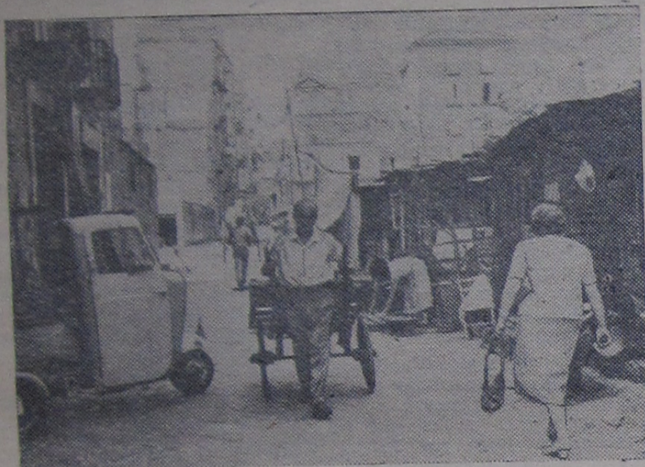
Италия. Неаполь. В этих районах живет беднота.