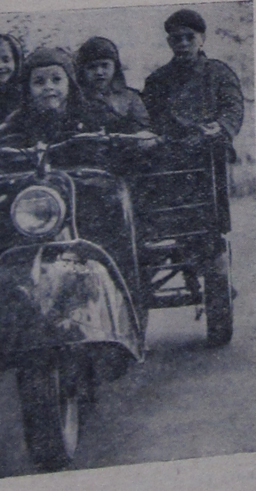
Любят ли дубненцы природу?

ДА, в большинстве своем любят. Нет необходимости это доказывать. Но вместе с тем среди нас есть и иные люди. Многие с огорчением вынуждены были смотреть на прекрасные яблони на волжской дамбе, которые как бы жалуются на грубую несправедливость, показывая свои