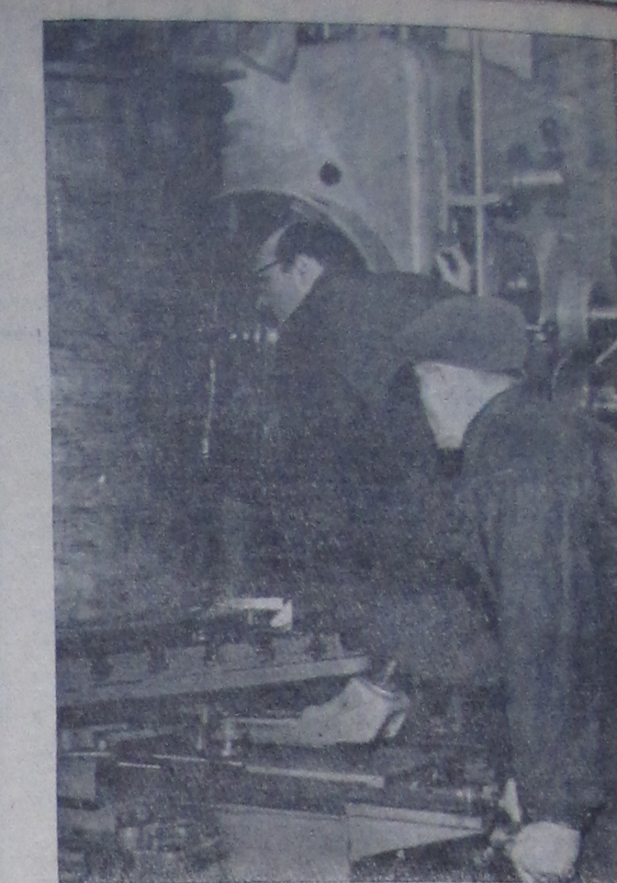
Изготовление сепаратора является первоочередной работой для коллектива производственно-технического отдела Лаборатории высоких энергий.

Вставлять стекла в окна они начали два месяца назад, привезли несколько ящиков стекла, а потом по неизвестной причине забрали его обратно. Не лучше обстоит и с монтажом отопительной системы. В производственных мастерских ежедневно работают 6—8 сантехников, что