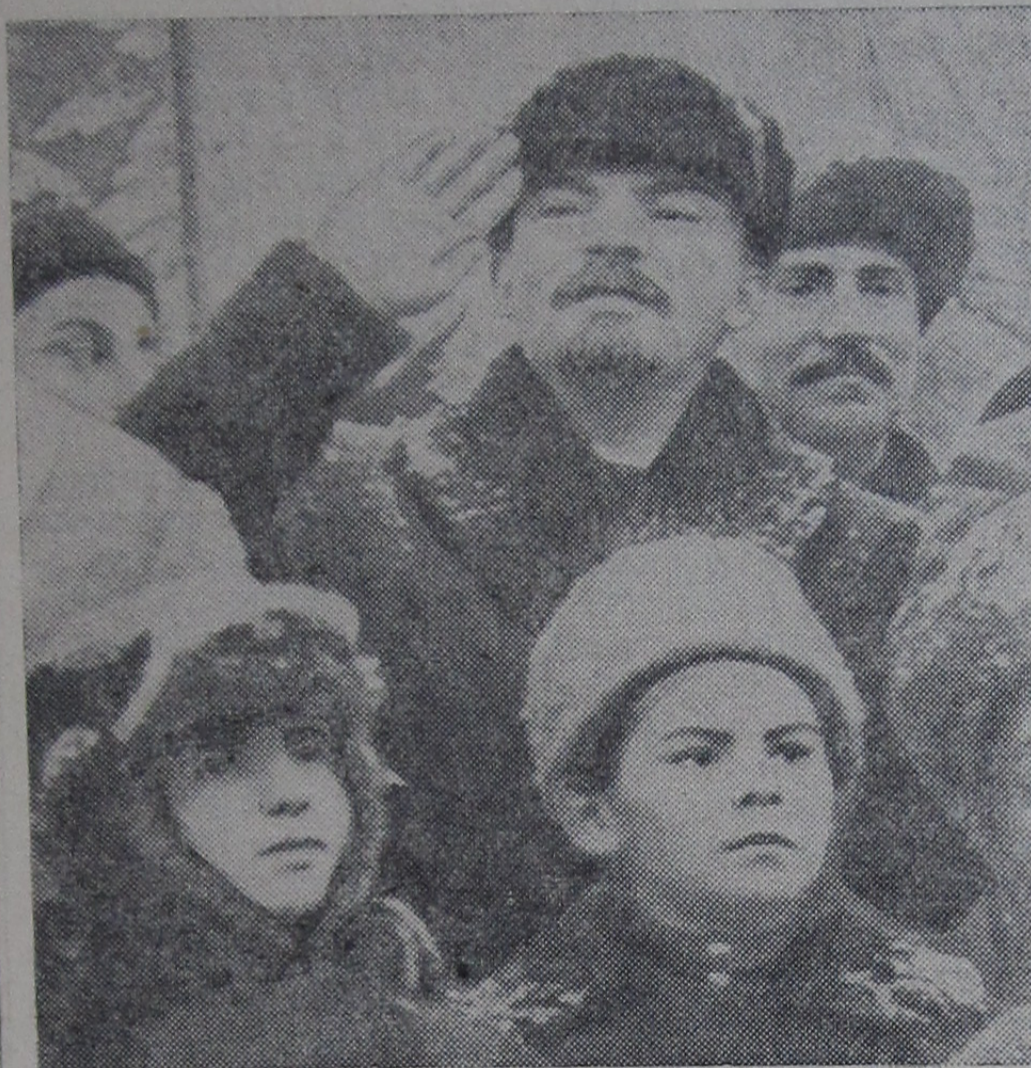
В. И. Ленин на Красной площади во время празднования 2-й годовщины Великой Октябрьской социалистической революции.

Его умение предвидеть, огромная энергия и настойчивость, его непримиримость в борьбе с оппор-