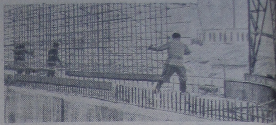
На строительстве Воронежской атомной электростанции кончен монтаж каркаса машинного зала, забетонирован фундамент турбогенератора № 1. В 1960 году должны быть завершены основные строительные работы на площадке электростанции.