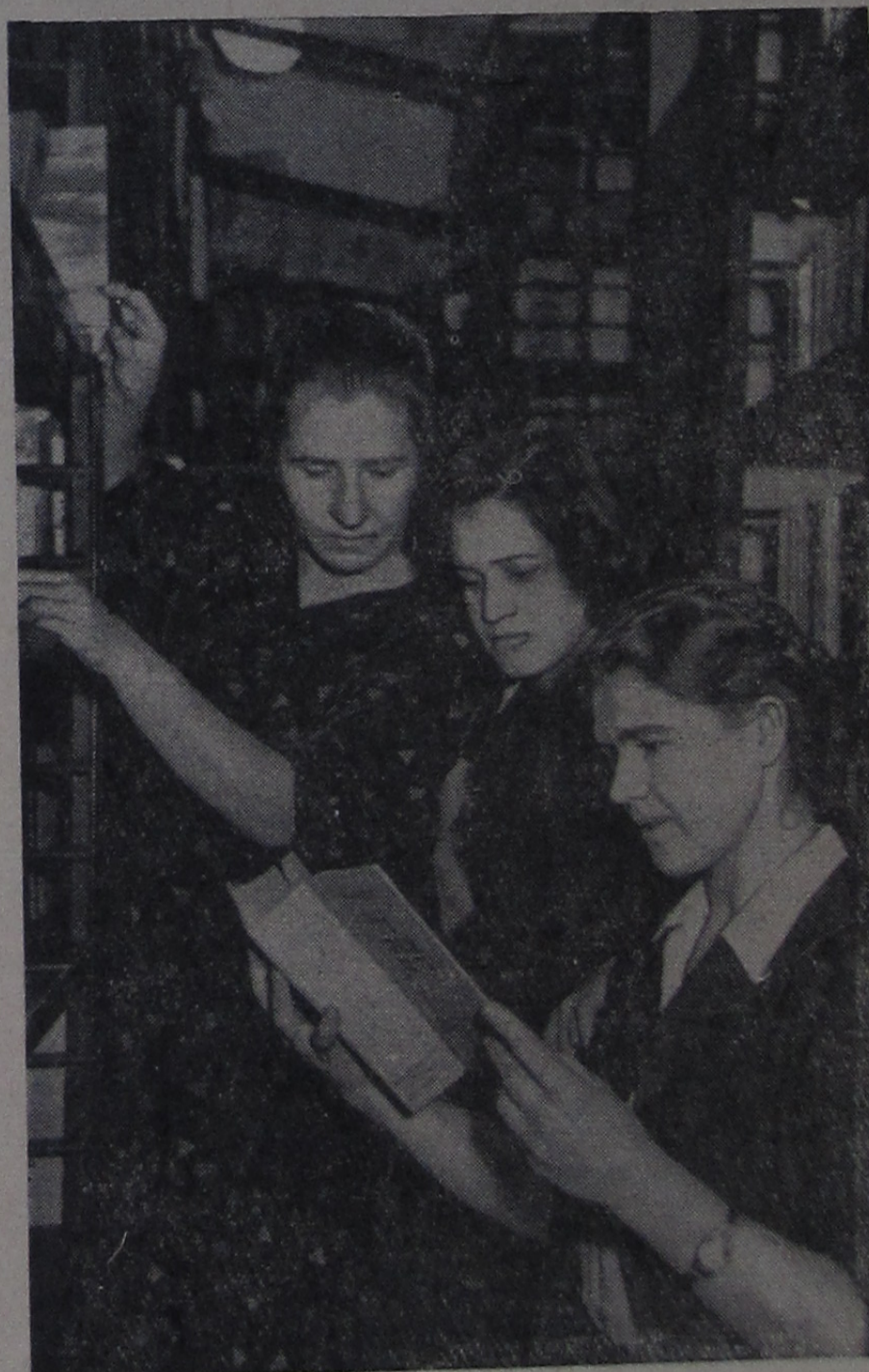
Творчески относятся к делу работники Иваньковской городской библиотеки. Они хорошо знают своих читателей и умеют предложить им книги, отвечающие их интересам и запросам. Особенно стараются библиотекари популяризировать новые книги.