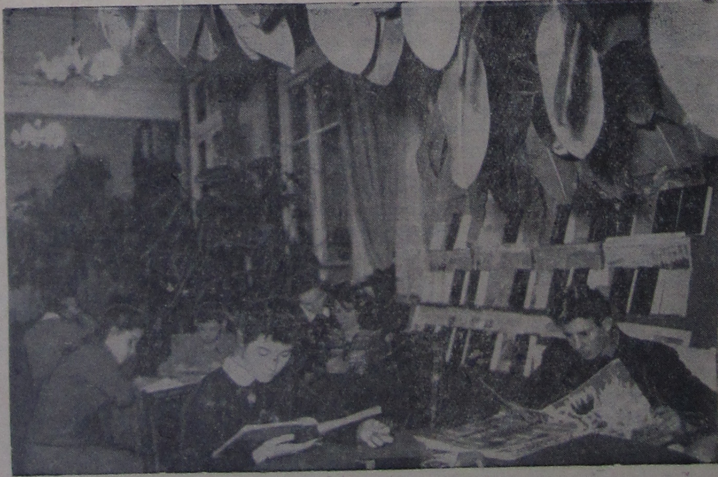
Любят наша молодежь книги — своих верных друзей. Они помогают разобраться в самых разнообразных вопросах, возникающих перед молодым человеком, вставшим на путь самостоятельной жизни. На снимке: в читальном зале Иваньковской библиотеки.