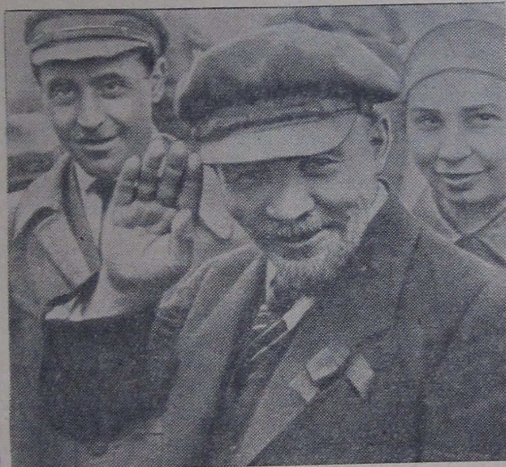
В. И. Ленин на закладке памятника «Освобожденный труд». Москва, 1 мая 1920 года (кинокадр). (Из альбома, подготовленного к выпуску Институтом марксизма-ленинизма при ЦК КПСС).