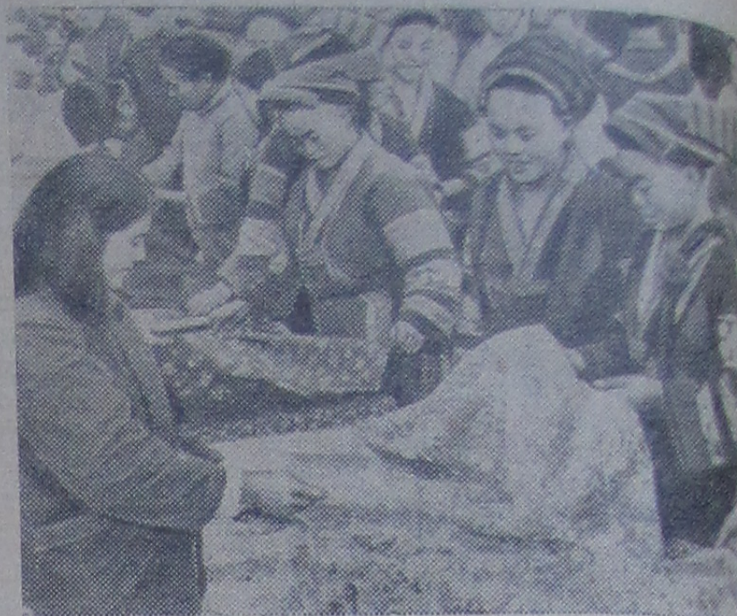
КИТАЙСКАЯ НАРОДНАЯ РЕСПУБЛИКА. Женщины-работницы национальных меньшинств покупают ткани на базаре в провинции Гуйчжоу (Юго-Западный Китай).