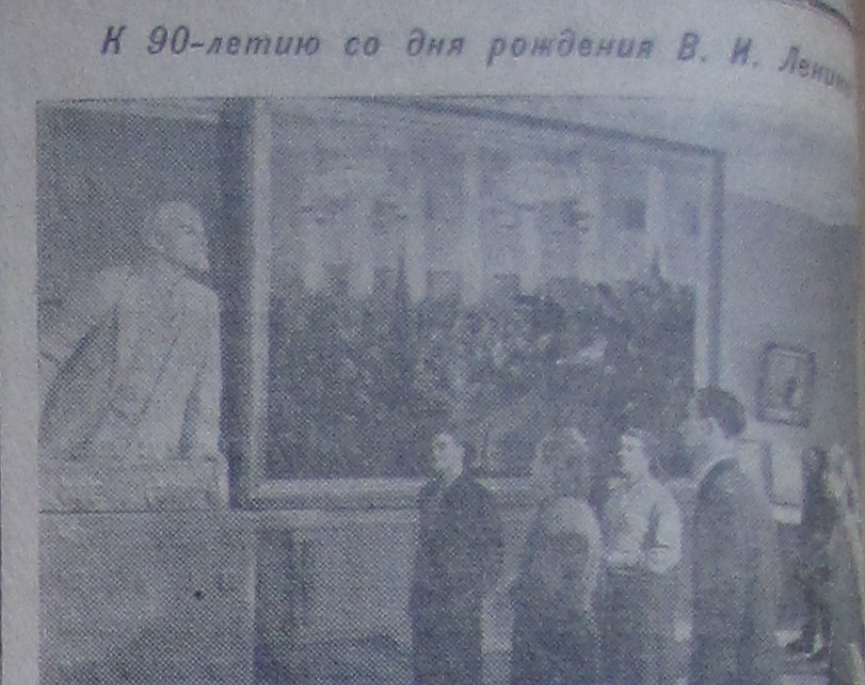
МОСКВА. В связи с приближающимся 90-летием со дня рождения В. И. Ленина все больше москвичей и гостей столицы посетили Центральный музей В. И. Ленина. Здесь за последнее время проведена большая работа по обогащению экспозиции. Все экспозиционные залы музея были капитально отремонтированы и реставрированы. В экспозиции представлены новые ленинские портреты, редкие фотографии, номера большевистских газет, пролетарские живописи и скульптуры. Сейчас в музее идет подготовка нескольких новых залов, материалы которых расскажут, как и народ превороят в жизнь заветы Ленина. На снимке: посетители в одном из залов музея.

Чудесный рефлектор позволяет врачу быстро и надежно разрешить эти сомнения, потому что в определенном узком спектре ультрафиолетовых лучей, безвредном для живого организма, раковые опухоли и метастазы дают ярко выраженное характерное свечение. В рефлекторе установлены две лампы ультрафиолетового излучения, снабженные соответствующими светофильтрами. Погасив обычное, видимое, освещение, врач включает эти лампы и сразу же обнаруживает, где болезнь поразила ткани. Это позволяет оперировать больного, что называется, с открытыми глазами, уверенно и точно. При снятом светофильтре лампы выполняют роль стерилизаторов,