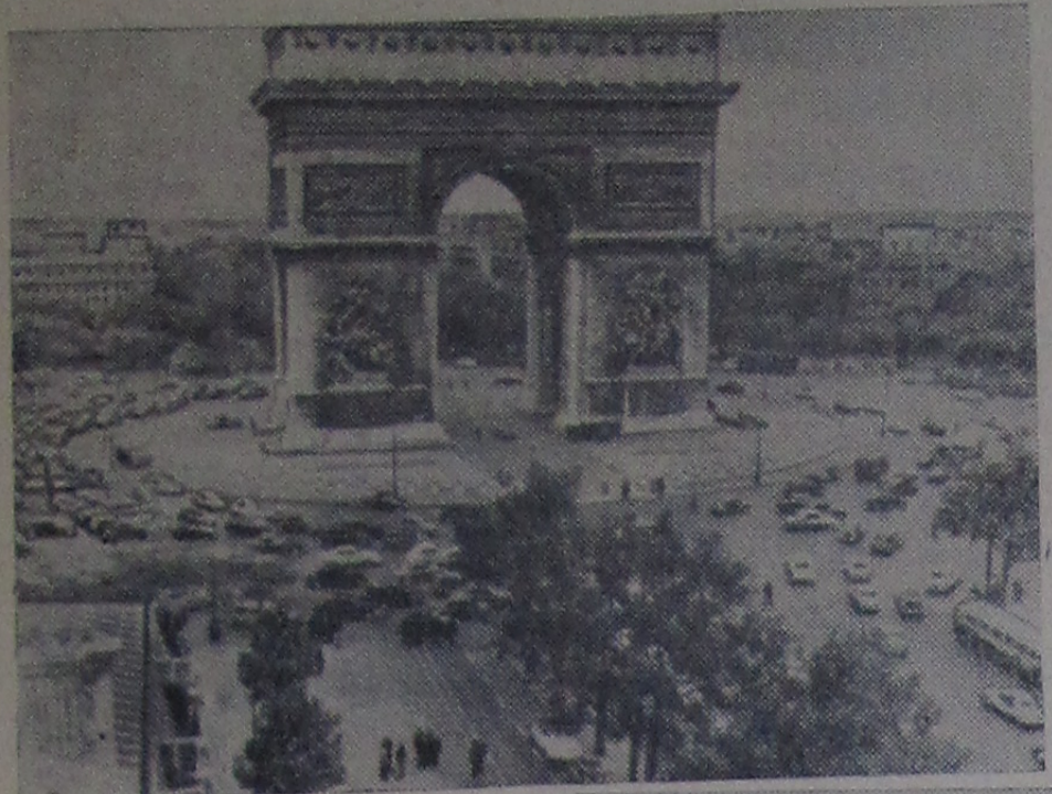
На снимках: Париж. Вверху — Площадь Звезды и Триумфальная арка. Внизу — Большие бульвары. Ворот Сен-Дени.