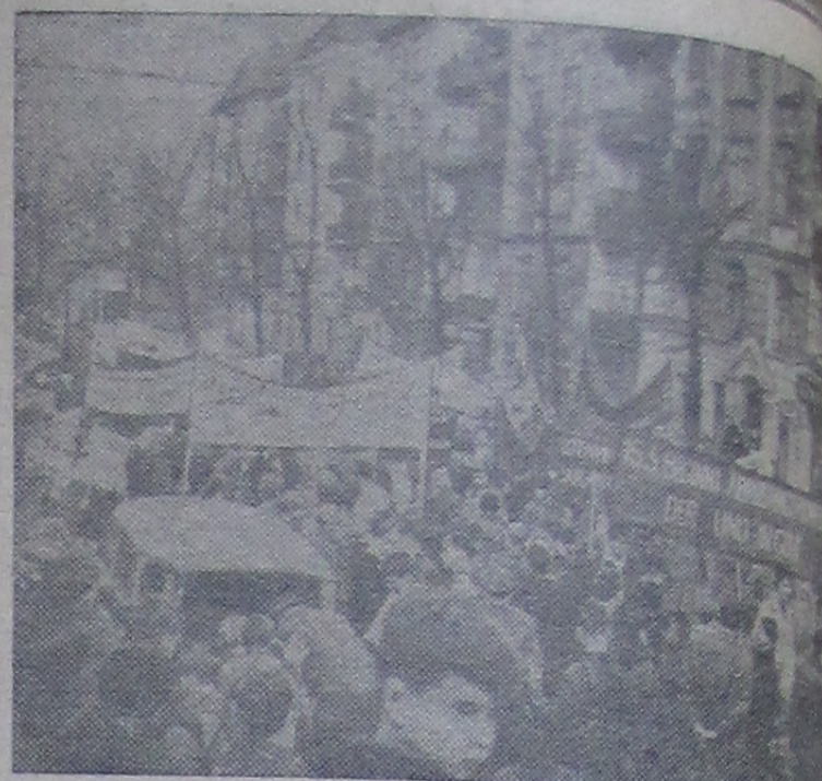
Федеративная Республика Германии. В Гамбурге состоялась демонстрация против атомного вооружения...