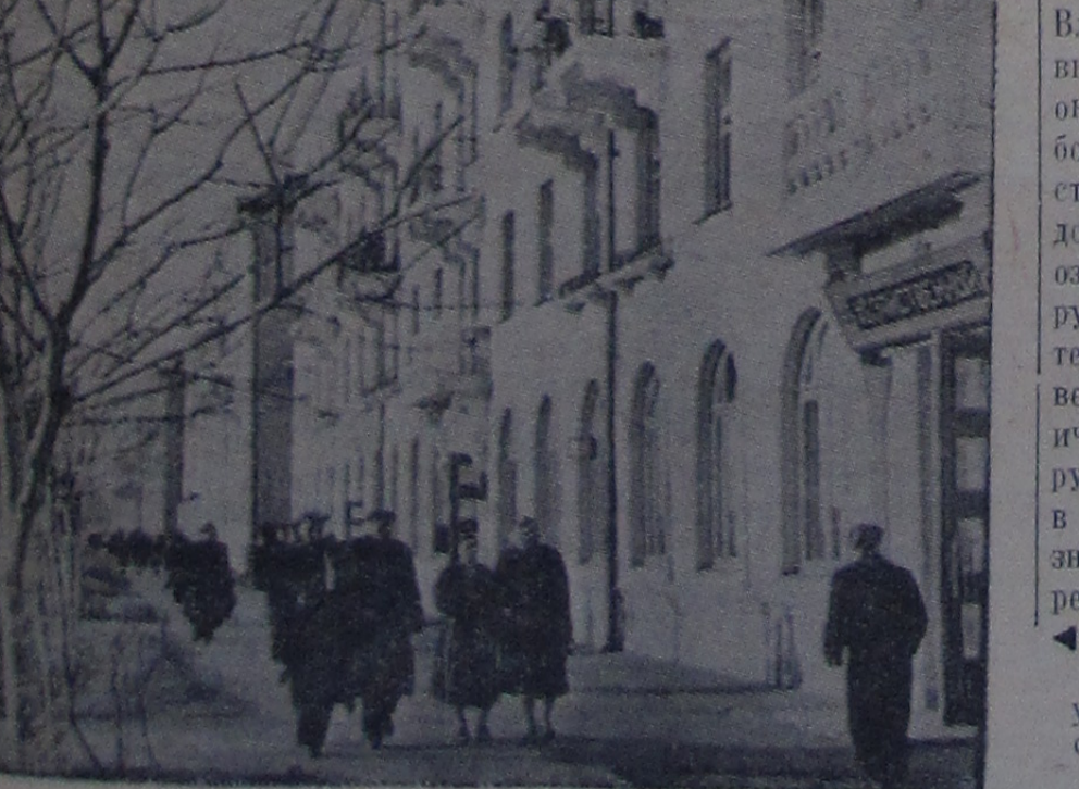
Одна из самых красивых улиц г. Ивановка — Октябрьская.

Владимир Ильич готовится к выступлению за границу. Почти на десять лет в музее демонстрируются личные вещи Ильича, использованные во время его пребывания в Финляндии. Миллионы газет и брошюр, длинных газет и брошюр, мени — свидетельства его работы, сделанные в период его пребывания за границей.