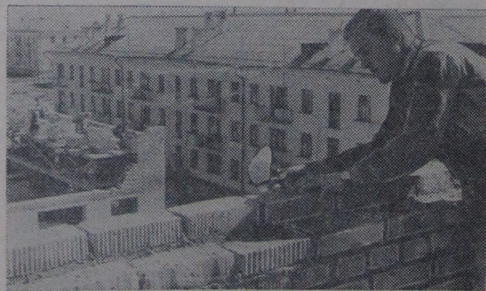
На строительстве жилого дома № 1 в 17 квартале. На переднем плане каменщик В. В. Кашулько.