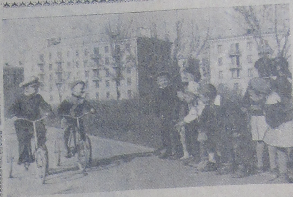
У финиша.