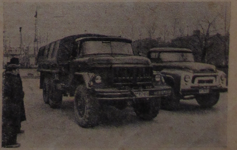
На снимке: «ЗИЛ-131» (слева) и «ЗИЛ-130».

«ЗИЛ-131» — новый, очень комфортабельный вездеход — будет выпускаться взамен трехосного грузовика «ЗИЛ-157».