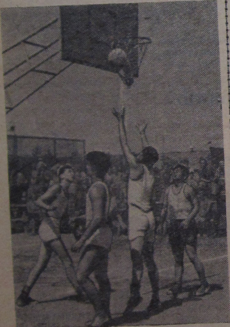
На баскетбольной площадке Дубненского стадиона часто можно наблюдать «сражения» команды баскетболистов научных сотрудников Китая и городской команды. Наш фотокорреспондент П. Зольников запечатлел встречу этих команд. Победителем вышли китайские товарищи.