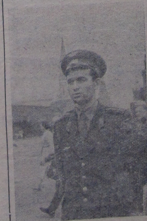
Капитан Василий Амвросевич Поляков — военный летчик, сбивший американский бомбардировщик 1 июля 1960 года.