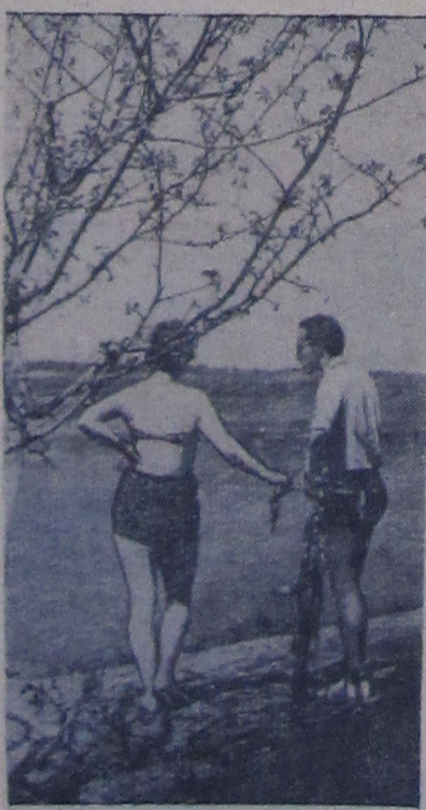
Стоит жаркая погода. В эти дни особенно многолюдно на волжском пляже. У Волги в жаркий день.

Туристы и отдыхающие совершают воздушные прогулки в Гагру, Сочи, на мыс Пицунда.