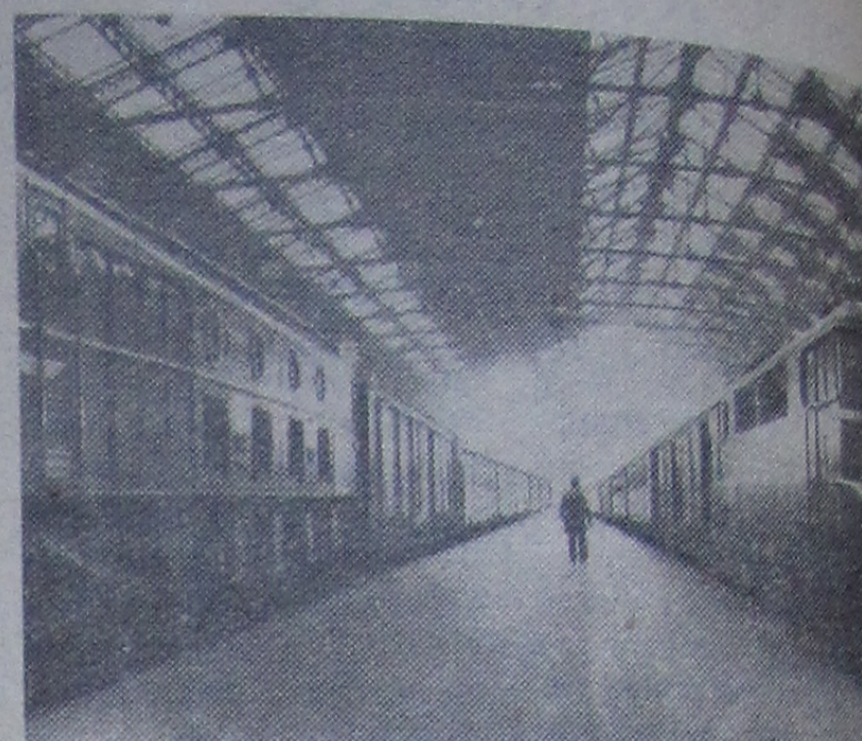
В конце октября железнодорожники Франции провели вую забастовку протеста против наступления правительства на профсоюзные свободы.

К железнодорожникам присоединились портовики, таксисты, водители автобусов. В этот день бастовали работники коммунального хозяйства Парижского района и персонал авиационной компании «Эр-Франс».