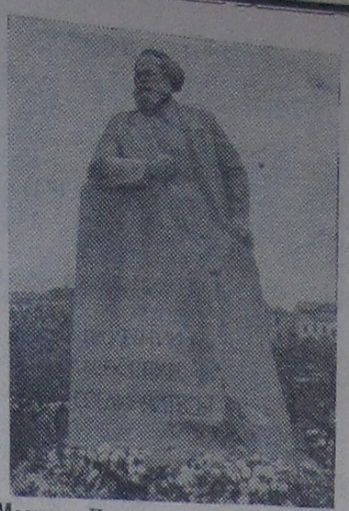
Москва. Памятник Карлу Марксу.

Видимо, воспитатели прочно заложили эти навыки у своих воспитанников. Единственное упущение — это неправильная осанка при письме, дети неправильно держали карандаши, и нам, учителям, очень трудно сейчас их переучивать. Воспитателям и родителям дошкольников надо научить детей держать карандаш так, чтобы кончик его был направлен в плечо. Расстояние от тетради до глаз должно равняться двум величинам ручки (карандаша). А. ПОСТНИКОВА, учительница школы № 5.