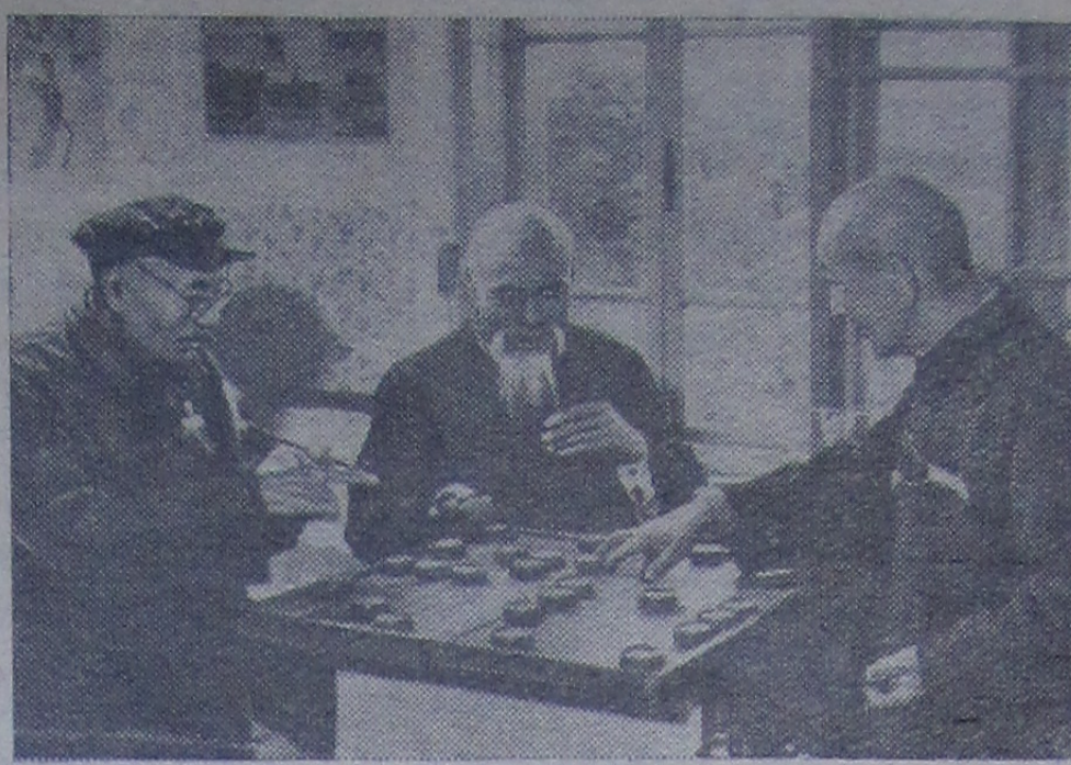
В Китайской Народной Республике для престарелых шахтеров Фусинского угольного бассейна открыт специальный дом.