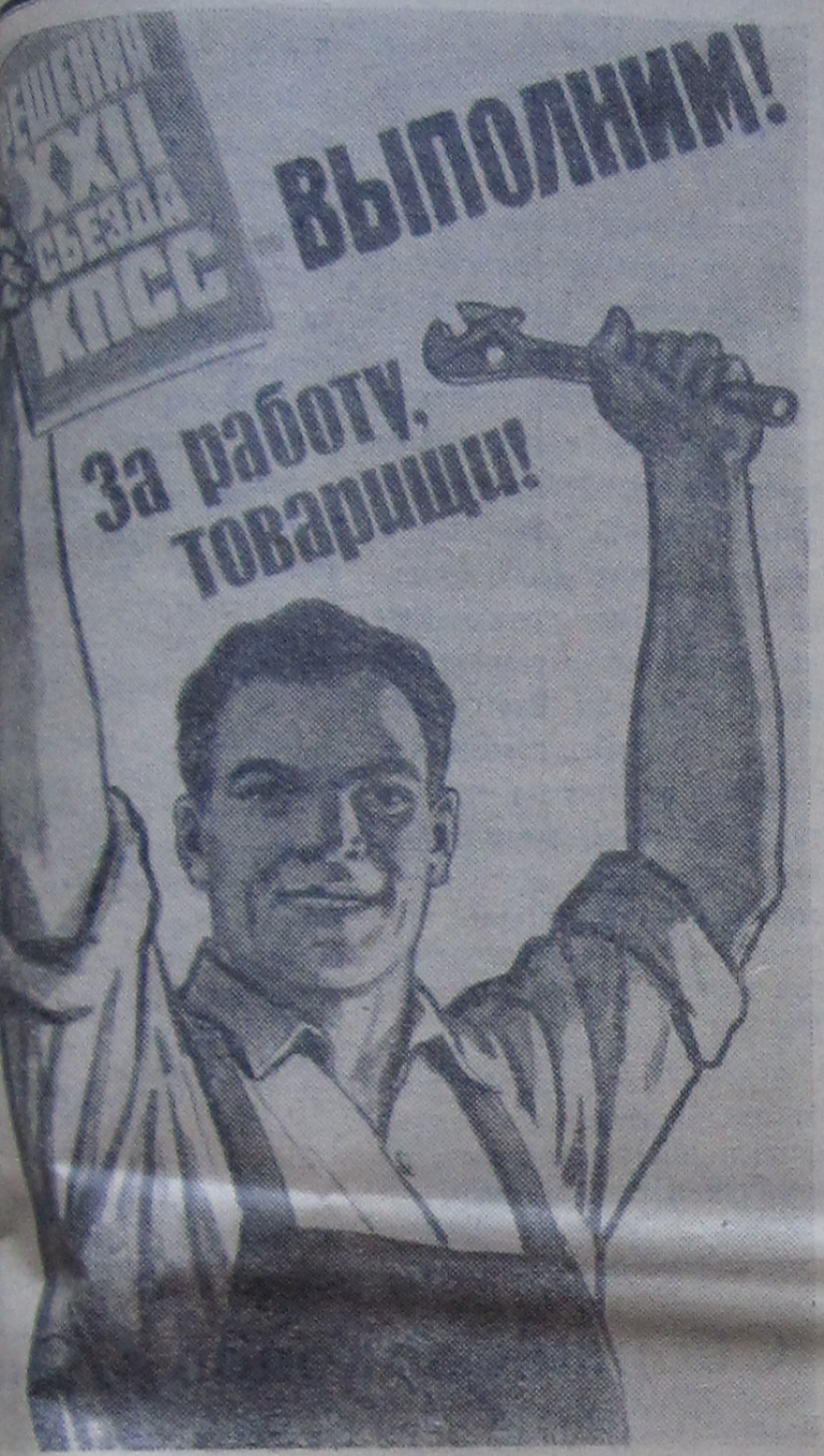
Плакат художника В. Иванова (ИЗОГИЗ).