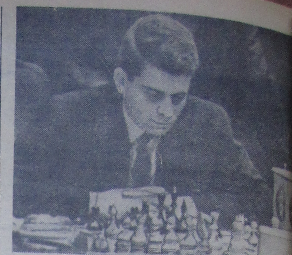
Баку. XXIX первенство СССР по шахматам. На снимке: лидер турнира гроссмейстер Б. Спасский (Ленинград).