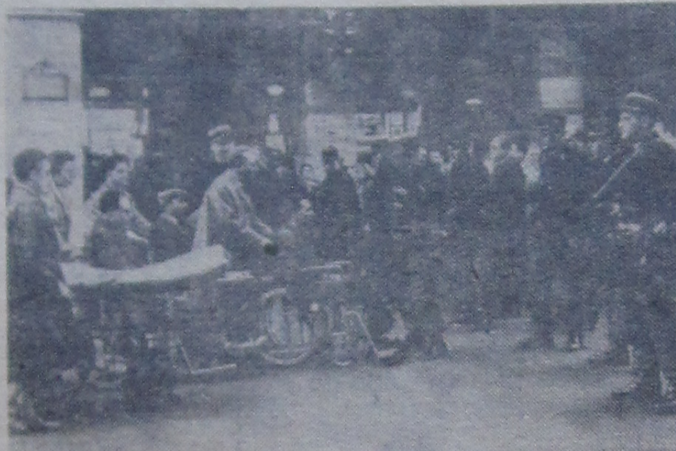
ФРАНЦИЯ. В Париже недалеко от площади Оперы состоялась демонстрация слепых и инвалидов. Ее участники сообщили представителям печати, что цель демонстрации — «напомнить» правительству о своем тяжелом положении.