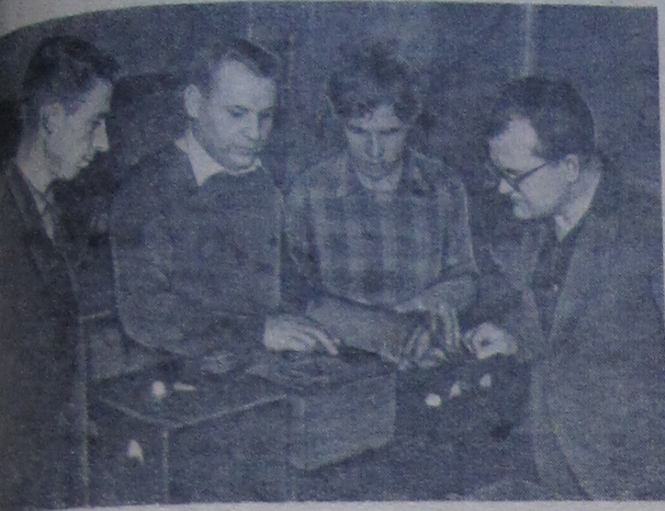
Наш фотокорреспондент П. Зольников запечатлел момент подготовки измерительной аппаратуры для проведения физических экспериментов по изучению параметров, относящихся к динамике движения частиц в релятивистском циклотроне с пространственной вариацией магнитного поля.