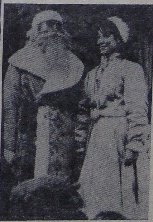
19 февраля жители левобережной части города отмечали «Праздник русской зимы». Перед многочисленными зрителями на ледяной эстраде выступили Дед Мороз, Снегурочка, Берендей, Лето. На снимке: Дед Мороз и Снегурочка поздравляют дубненцев с праздником.