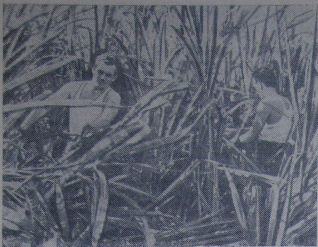
Недавно советский крупнотоннажный теплоход «Лесозаводск» доставил в Кубинскую Республику товары. Прибыв в порт, советские моряки пожелали принять участие в уборке сахарного тростника. Несмотря на неопытность, матросы собрали большое количество тростника. Члены кооператива горячо благодарили советских моряков за помощь. На снимке: советские матросы срезают тростник на плантации.