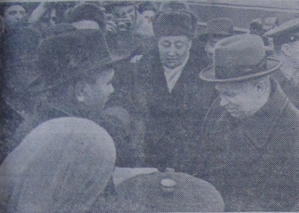
17 марта Н. С. Хрущев по пути из Акмолинска в Алма-Ату посетил овцеводческий совхоз «Рославльский» Джамбулского района. На снимке: на станции Отар Казахской железной дороги трудящиеся встречают Н. С. Хрущева по старинному обычаю хлебом-солью.