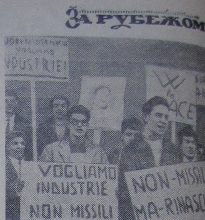
Молодежь острова Сардиния выражает решимость против политики, ведущей к усилению международной авиации, что вызывает негодование местных жителей — молодых батраков, шахтеров и студентов, прибывших в населенных пунктах острова, провели демонстрацию с плакатами «Хотим промышленность, а не ракеты!».