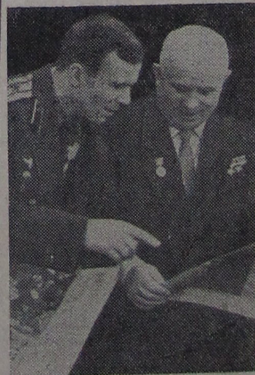
Н. С. Хрущев беседует с первым в истории космонавтом Ю. А. Гагариным на приеме в Большом Кремлевском дворце 14 апреля 1961 года.