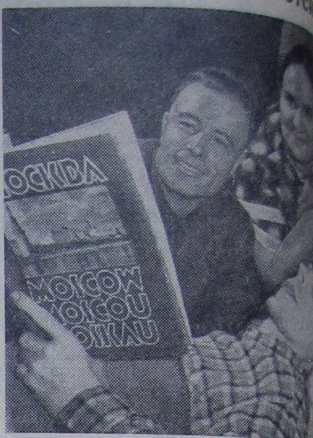
НОВОСИБИРСК. Рабочий коммунист А. О. ...