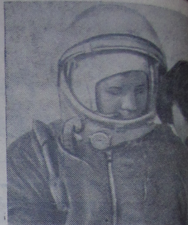
Первый в истории человечества космонавт...