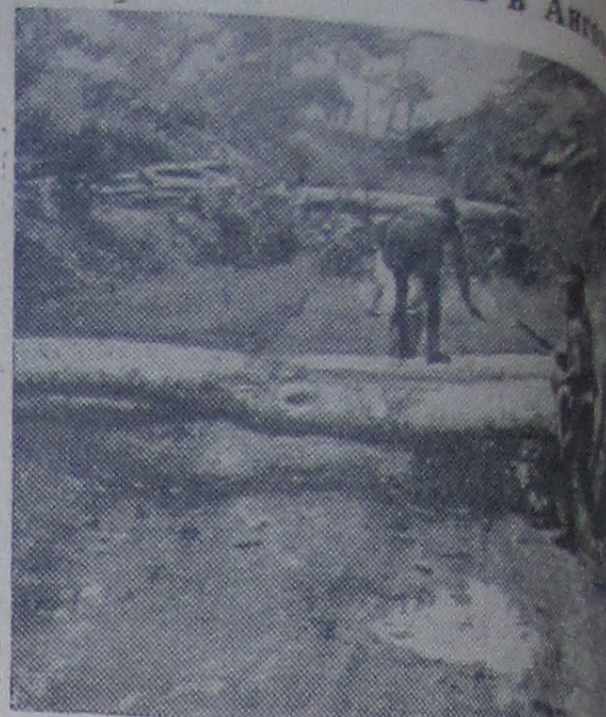
Африка. Северная часть португальской колонии восстанием. Несколько тысяч повстанцев участвуют в боях против сил колонизаторов. На снимке: заграждения, устроенные повстанцами.

Весна пришла! Тепло и солнечно на душе, когда в небе призывно и торжественно звучит песня жаворонка, сливаясь с щебетанием веселых скворцов, слышащих родные места после долгого отсутствия на чужбине, когда лопаются почки на деревьях. Хорошо в эти дни в пробуждающемся лесу.