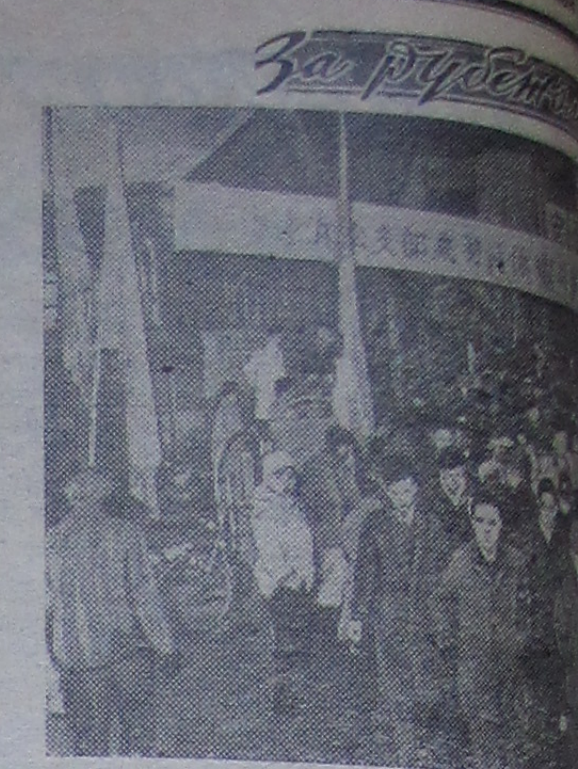
Члены национального совета крупнейших железнодорожных узлов требуют повышения заработной платы, держано отправление 78 товарных и 91 пассажирских вагонов на станции Хамамацу.

Адрес редакции: гор. Дубна, Советская 11, Телефоны редактор-Институт 2-81, общий-городской АТС 75-23 и 74-73. Дни выхода газеты: Дубненская типография Мособлполиграфиздата