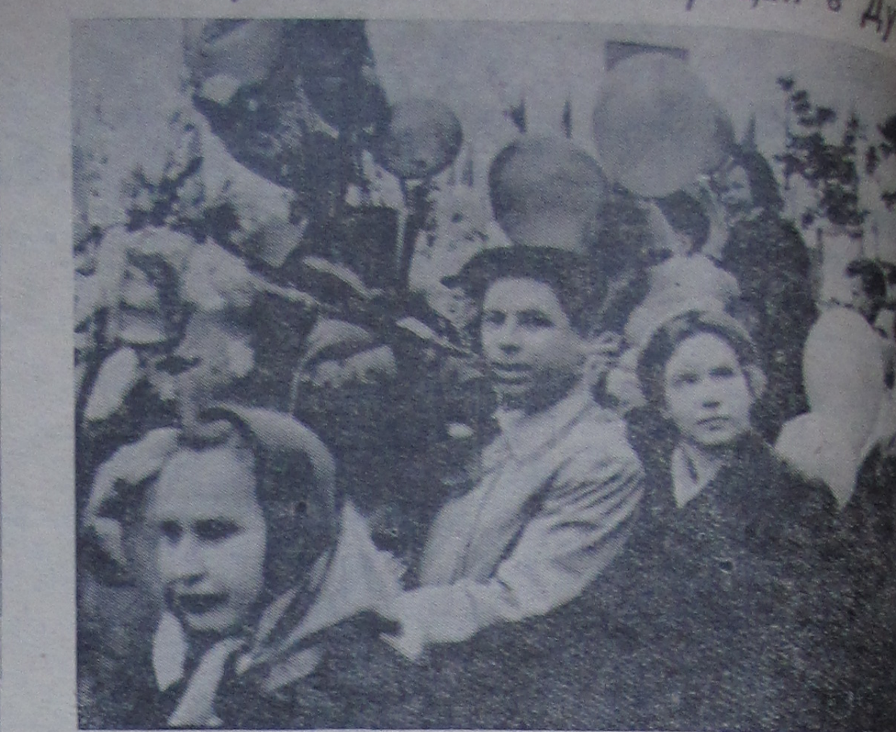
По страницам московских газет