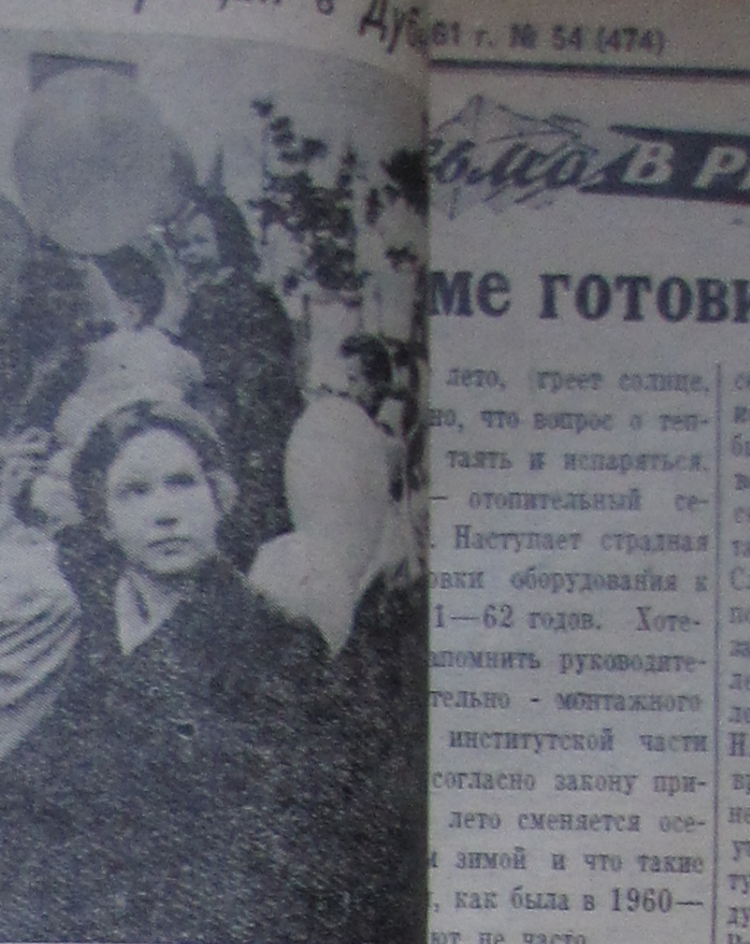
На верхнем снимке: демонстрация на левобережье.

Каждая бригада имеет свои обязательства, но есть и общие для всех бригад. Так, например: выполнять задание мастера в срок и досрочно,