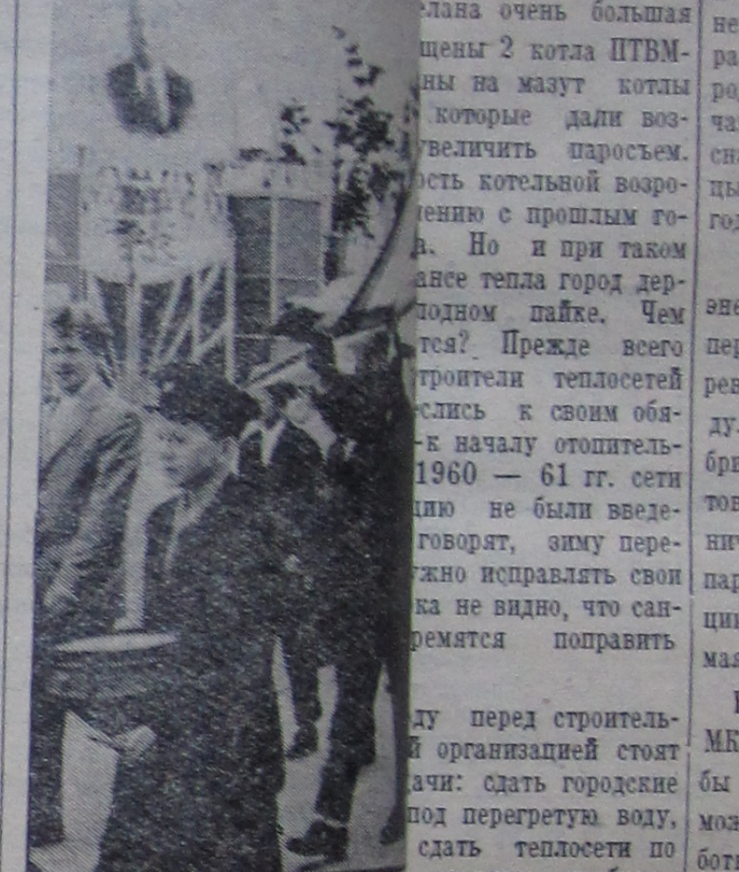
На нижнем снимке: колонна в честь 10-летия революции на левобережье.