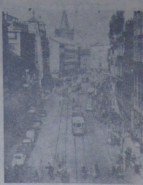
Улица на Прижиопе в Праге.

Чешские девушки встречали освободителей цветами. Все машины были заполнены чешскими детьми и молодежью, среди цветов трудно было разглядеть нас, советских воинов. Весь день слышались музыка, песни. Прага ликвала, отмечая день своего освобождения. Каждый наш солдат был желанным гостем в чешской семье. Вечером радио донесло до нас — Германия капитулировала. Победа!