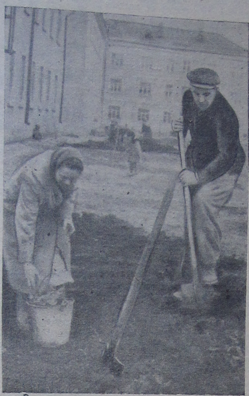
Тот, кто любит свой родной город, делает все, чтобы он хорошо выглядел с каждым днем. Сотни дубненцев приняли участие в воскресниках по уборке и озеленению улиц и скверов.