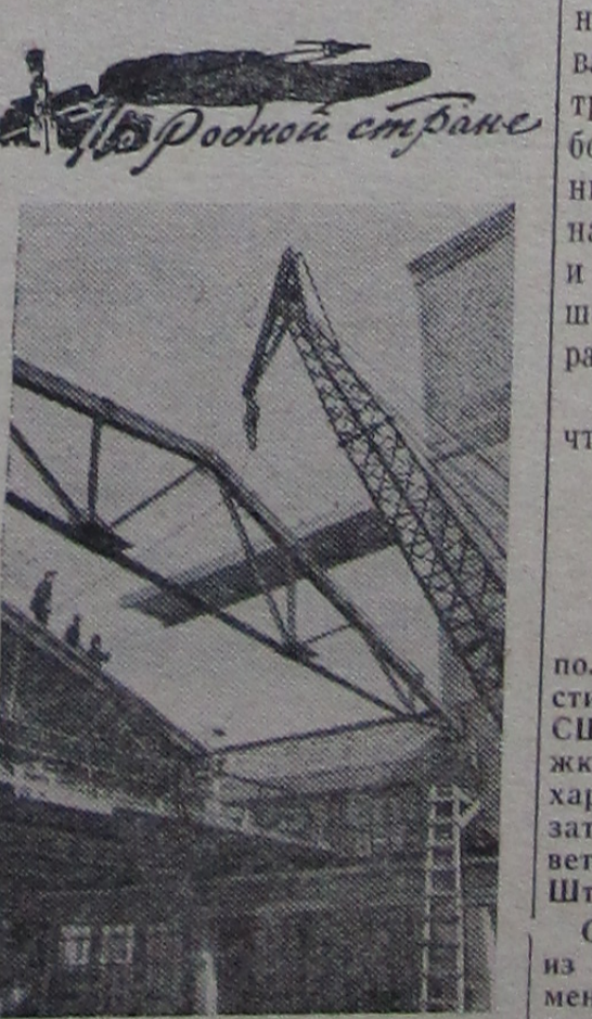
На строительной площадке, где будет воздвигнут Сыктывкарский целлюлозно-бумажный комбинат, сооружаются подсобные предприятия. На снимке: один из участков строительства бетонного завода и железобетонных конструкций комбината производственных предприятий.