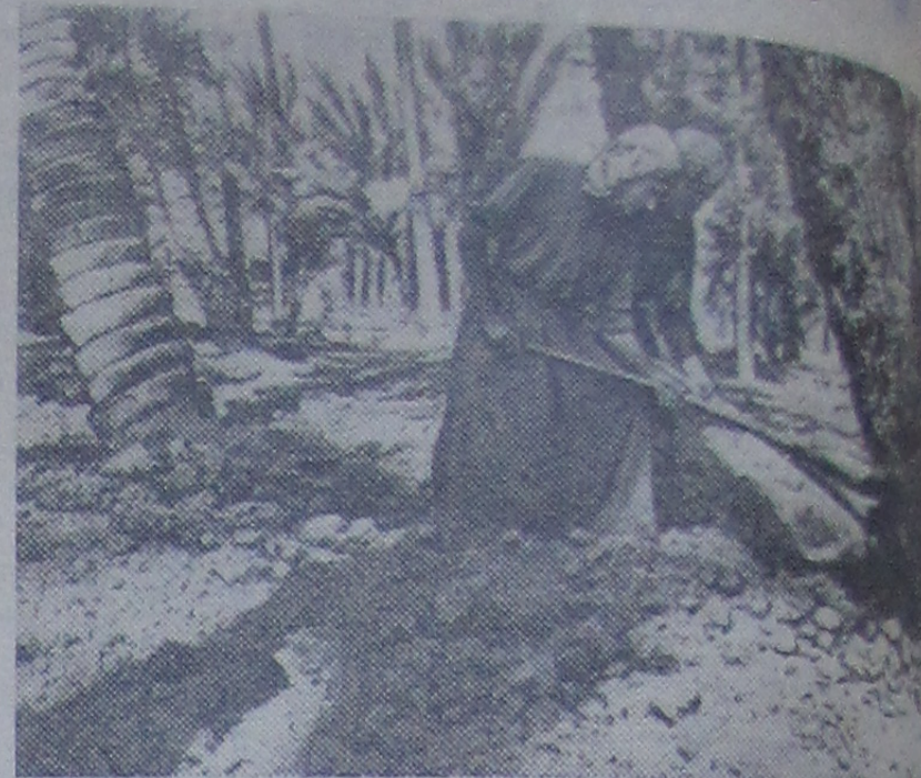
В Иракской Республике произрастает около 350 миллионов финиковых пальм. Всего насчитывается свыше 30 миллионов финиковых пальм, идущих на экспорт, а древесина используется на строительстве.

На снимке: крестьяне обрабатывают землю под пальмами в районе Басры.