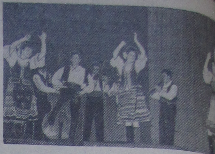
Темпераментно исполняет хореографический коллектив вобережья венгерский танец. Постановщик танца Б. Т.